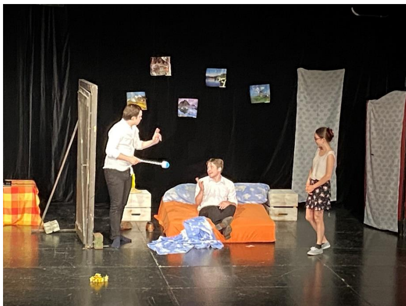
Představení Dokonalé svatby ve Studiu Z Městského divadla Zlín

Čtvrteční skupina ještě starších žáků připravovala během školního roku inscenaci hry Viliama Klimáčka "Láska jest chemie", kterou jsme uvedli s velkým ohlasem 16. 6. 2022 v Dílně Městského divadla Zlín.