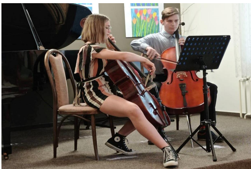
Mladí violoncellisté na školním koncertě

smyčcový orchestr, soubor zobcových fléten, kytarový soubor, pěvecký sbor, školní kapela a další příležitostná uskupení komorní hry.