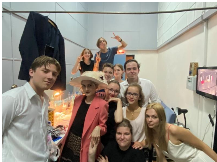
V herecké šatně

Na začátku školního roku byl celkový počet žáků LDO 51, v jeho závěru končilo 48 žáků. Pracovní výsledky všech skupin byly více než dobré a ohlasy na vystoupení byly nadstandardní. Celkově snad můžeme hovořit o kvalitních prezentacích i průběhu celého školního roku.