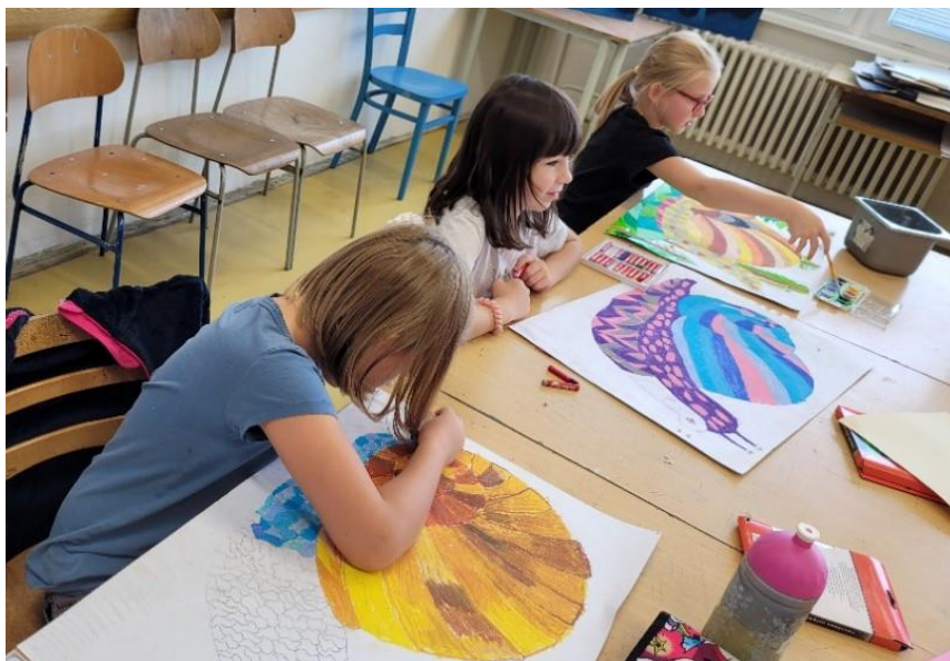
Výtvarný obor v Kvasicích

Celý školní rok doprovázely prezentace v elektronické podobě, které byly nejen inspirací pro žáky, ale také ukázkou tvorby a činnosti výtvarného oboru.