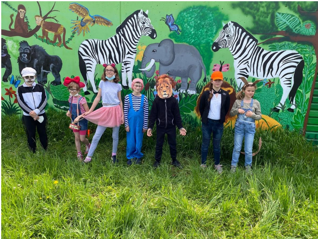
Z natáčení Zušáčka