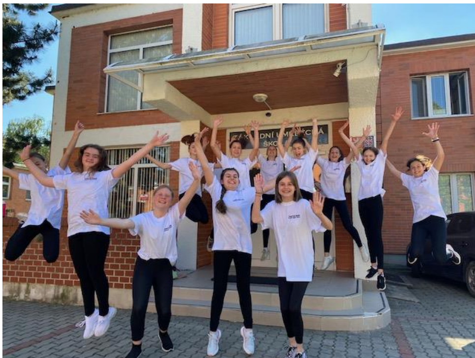
Z natáčení flashmobu