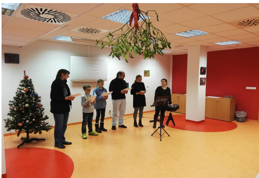
Vystoupení v Senioru C