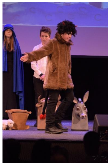
Literárně-dramatický obor ve hře o Ježíškovi