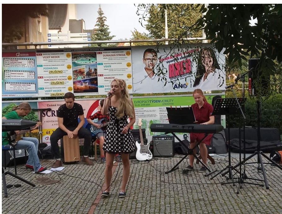
Open air vystoupení před Otrokovickou Besedou

Proškolení všech zaměstnanců v oblasti BOZP a PO je prováděno pravidelně. Roční kontrola BOZP a PO byla provedena ještě v přípravném srpnovém týdnu. V oblasti PO nebyly zjištěny zjevné závady. Zápisy do požární knihy jsou prováděny při kontrolách stavu objektů a při revizi hasicích přístrojů a hydrantů. V oblasti BOZP byl sestaven plán opatření, který škola postupně plní. Závady zjištěné v průběhu roku jsou průběžně odstraňovány. Podle harmonogramu byly odborně způsobilými firmami prováděny revize – například revize elektrického zařízení, hasicích přístrojů a hydrantů.