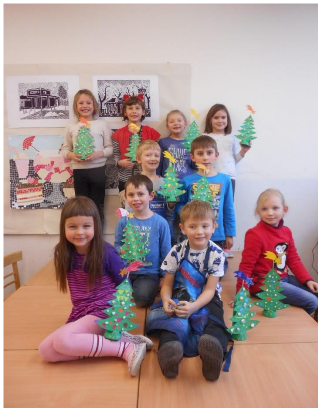
Výtvarný obor v Kvasicích